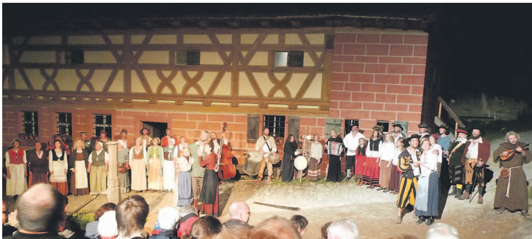
Das Schlussbild versammelte sämtliche Schauspieler auf der „Bühne“ vor der Unterschlaubersbacher Mühle, danach gab es begeisterten Applaus und viele „Vorhänge“. Zum Dank an das Ensemble waren bunte Leuchtstäbe verteilt worden, die die Zuschauer schwenkten. Ein farbenprächtiges Feuerwerk, das vor dem Eingang zum Freilandmuseum gezündet wurde, schloss sich an.