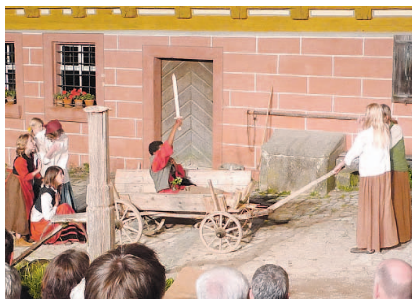
Eine der schönsten Szenen mit der Kindergruppe: Sie spielen, dass der Müller als Gefallener aus dem Krieg heimkehrt und zu Grab getragen wird. Der „Gefallene“ nimmt hier nur kurz eine Siegerpose ein, will heißen: Er ist als Held gestorben.

Wie immer bot das Freilandtheater eine bestechende Kombination: originelle Musik und bunte Szenen, Tiefgang und Humor, Tragikomisches. Und der Abschied für heuer wird versüßt durch die Vorfreude auf die nächste Saison.